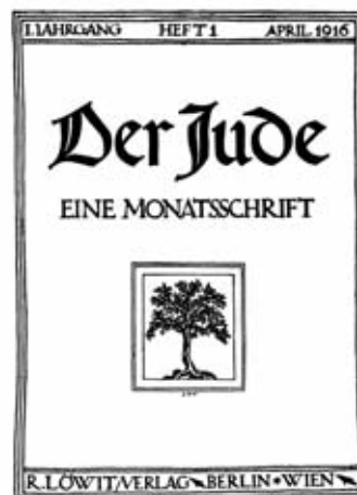
Titelseite der Monatszeitschrift »Der Jude«, Erstausgabe im April 1916. Von Martin Buber stammte der erste Aufsatz »Die Lösung«. Die Zeitschrift erschien bis 1924.

Der Weg dahin führt über »das kostbarste Erbe des klassischen Judentums: ... die Tendenz der Verwirklichung. Diese Tendenz bedeutet, daß das wahre Menschenleben das Leben im Angesichte Gottes ist. Gott ist dem Judentum keine kantische Idee, sondern elementar gegenwärtige Substanz – weder ein von reiner Vernunft Gedachtes noch ein von einer praktischen Postuliertes, sondern die Unmittelbarkeit des Daseins schlechthin, das Geheimnis der Unmittelbarkeit, dem der fromme Mensch standhält, der unfromme ausweicht – er ist die Sonne der Seelen. Aber nicht der hält stand, nicht der lebt im Angesichte Gottes, der sich von der Welt der Dinge abwendet und selbstvergessen in die Sonne starrt, sondern der in ihrem Lichte atmet, in ihrem Lichte wandelt, sich und alle Dinge in ihrem Lichte badet. Wer sich von der Erde abkehrt, er faßt Gott nur als Idee, nicht als Wirklichkeit, er wird nur seiner Einheit, nicht auch seiner Allheit habhaft, er hat ihn im Erlebnis, er hat ihn nicht im Leben. Aber auch wer sich der Erde zukehrt und Gott in den Dingen schauen will, lebt nicht wahrhaft in dessen Angesicht. Gott ist in den Dingen nur