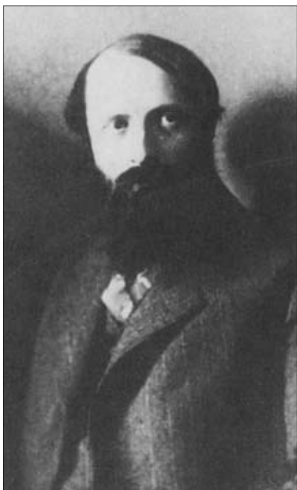
Martin Buber, 1916.

trachtungsweise des Krieges nicht ab. Sein Vortrag ›Die Tempelweihe‹ war im Dezember 1914 gehalten worden; auf dasselbe Thema kam er in seinem Essay ›Die Losung‹, welches er der Zeitschrift Der Jude voranstellte, noch einmal zurück.« 20