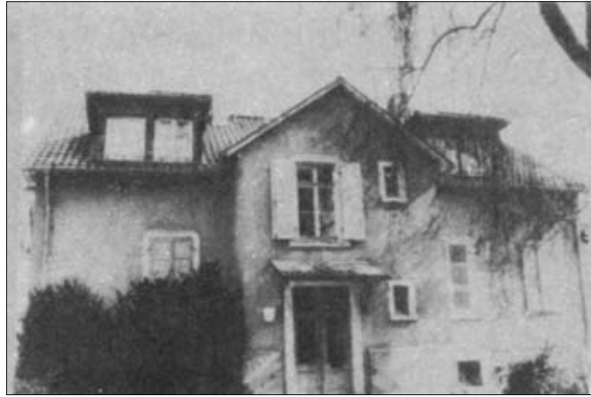
Das Haus in Heppenheim an der Bergstraße zwischen Darmstadt und Heidelberg, wo die Familie Buber von 1916 bis 1938 wohnte.

Bubers Briefwechsel sind es, die uns heute Auskunft über Bubers Begegnungen und Erlebnisse mit seinen Freunden geben. Aber in welchem Zeitraum sollen wir suchen? Interessant ist,